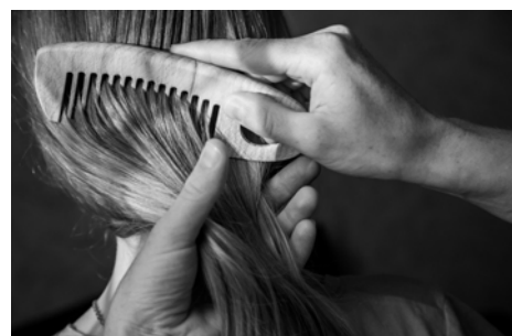
С невероятной теплотой кормящая, ухаживающая и заботящаяся.