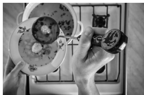
И обязательно будет толк - пустоцвета в любящих руках быть не может!