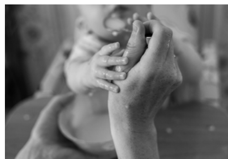
Мама, любящая своё чадо и выводящая его в мир.