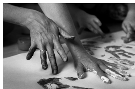
Читающая первые строки, пишущая вместе первые слова, и весело учащая рисовать (даже, если сама этого не умеет!)