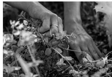
Она и вылечит, и вымоет, и освободит!